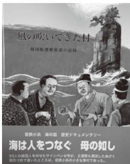
絵本 風の吹いてきた村