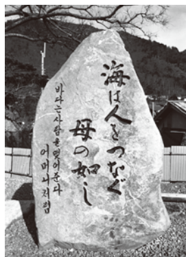
韓国船救護記念碑

2000年以後、この記念碑を多くの人が見学に来るようになりました。行政、各種団体など多様です。この22年間で3000人を