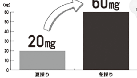
ほうれんそうのビタミンC

そして最後に、『野菜は体ごと』『野菜を100%食べるべし』という誰もが知っていること、聞いたことある言葉だと思えます。野菜に含まれるビタミンやミネラル、食物繊維などが