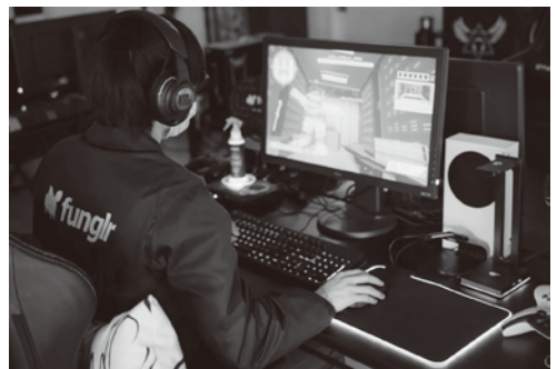
▲eスポーツをプレイする様子。この写真では、パソコン、マウス、キーボード、ヘッドホン等を使用している。

世界的にはパソコンでプレイするユーザーが多いですが、プレイステーションやSwitch