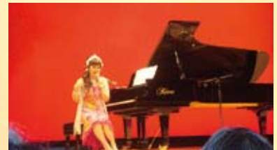
看護の日 in アオッサ大ホール