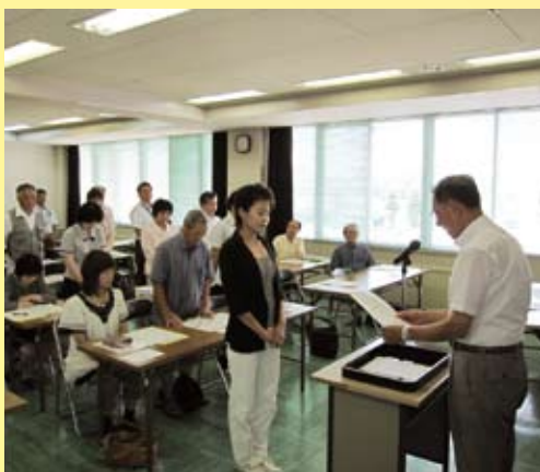
〈決定通知を受け取る助成団体代表者〉