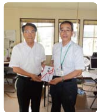
支援金の目録を手渡す (陸前高田市社会福祉協議会事務所)

「つないで陸高! なじよにがすっぺ」のスローガンのもと県内社協と現地社協とのつながりがさらに深く高まっていくことが期待されます。