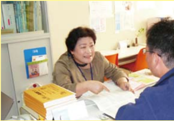
求職者との相談の様子（写真説明）

ここに、より専門的な相談に応じるためにアドバイザーを派遣した事例、職業紹介をした事例、在職者の相談を受けた事例をご紹介します。