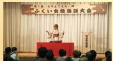
第3回ちりとてちん杯女性落語大会 in 小浜