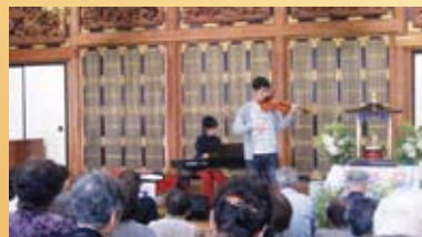
息子たちの演奏 in 蔵教寺